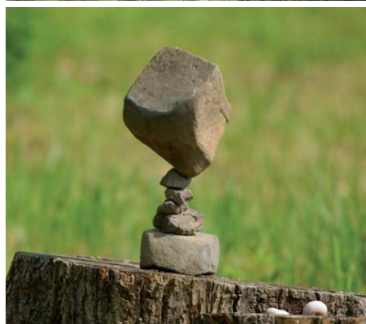
FOTOGALERIE LAND-ART DĚL Z FESTIVALŮ PROMĚNY